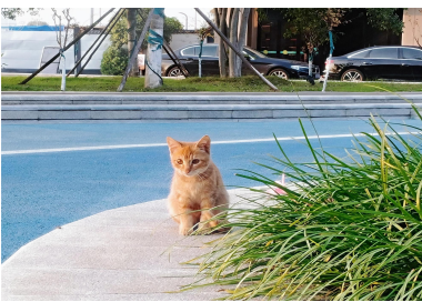
▲来源：民航运输 2503 许梦琴